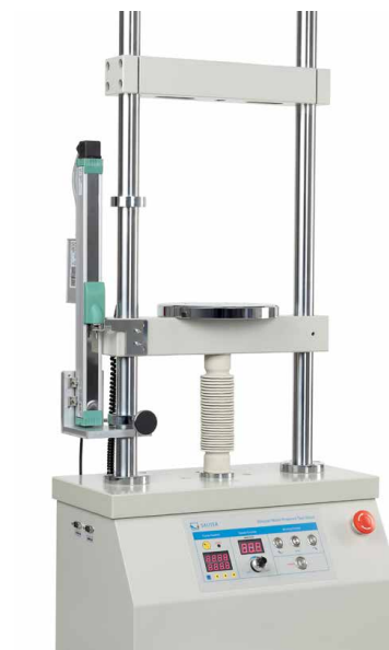
Banc d'essai motorisé incl. appareil de mesure de longueur LD