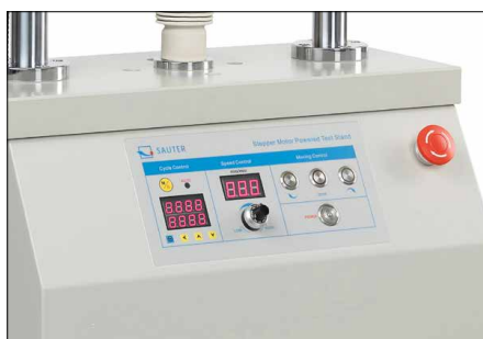
Tableau de commande haute gamme